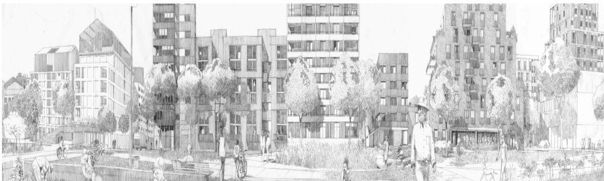
Illustration des jardins de l'Estuaire (@ Stéphane Guedon)

Dialogue citoyen fin 2022 : pour assurer aux futurs habitants du quartier République une qualité de vie dès leur installation, la Métropole et la SAMOA souhaitent réaliser les jardins de l'Estuaire au fur et à mesure de la livraison des opérations immobilières. Pour ce faire, la SAMOA a lancé les études de conception qui feront l'objet de démarches de dialogue citoyen à partir de l'automne 2022.