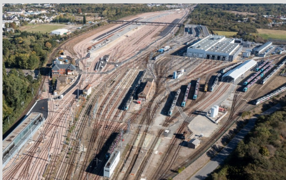
Site ferroviaire de Nantes-Blottereau

Le transfert achevé participera à la modernisation du réseau et permettra de répondre aux nouveaux enjeux du système ferroviaire. Le développement du site de Nantes-Blottereau (photo ci-contre) facilitera le trafic de trains de fret et optimisera la gestion des trains de voyageurs et la logistique des chantiers ferroviaires. La mutualisation des deux faisceaux ferroviaires sur un seul site au Grand-Blottereau et l'installation de nouveaux postes de commande apporteront gain de performance et facilité d'exploitation. Sa mise en service est prévue pour novembre 2022.